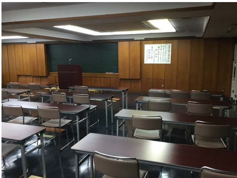
國語問題協議会の講演會会場